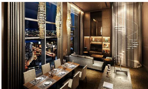
パーティールーム(完成予想図)