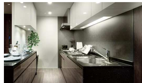
モデルルーム写真(キッチン)