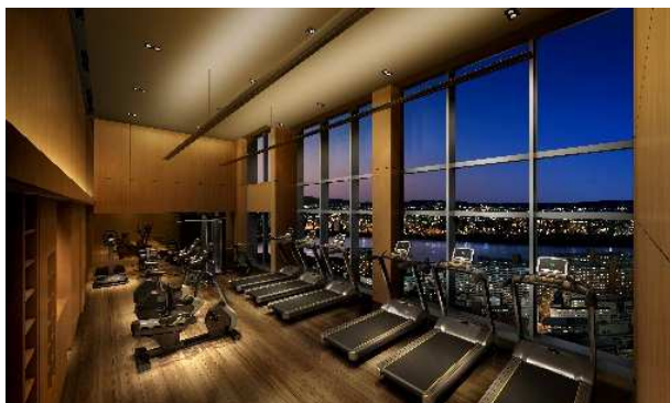
スカイフィットネス(完成予想図)