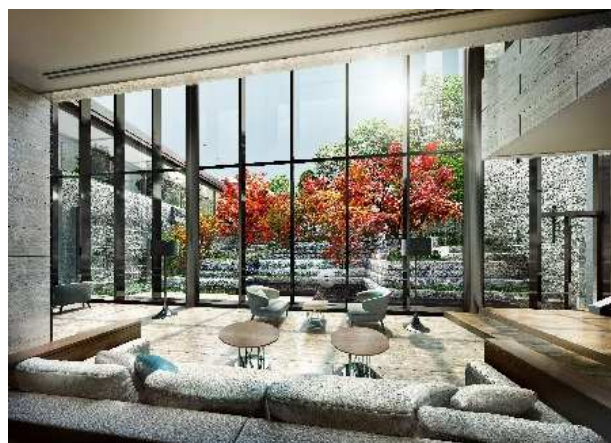
ガーデンラウンジ(完成予想図)