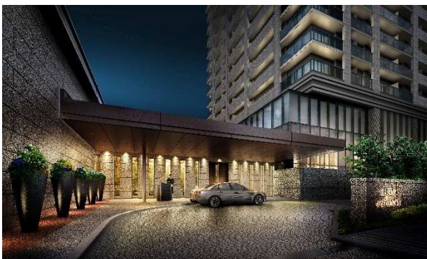
コーチエントランス(完成予想図)