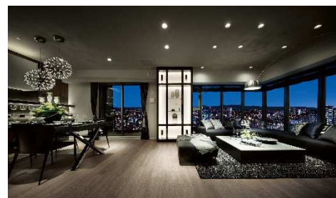
モデルルーム写真(リビング・ダイニング)