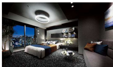
モデルルーム写真(ベッドルーム)