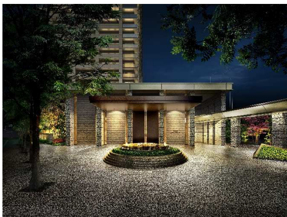
エントランスゲート(完成予想図)

東洋ホテルは1969年、総入場者数6千万人以上を記録し経済大国・日本を世界に印象づけた大阪万博(1970年)の開幕を前に開業し、高度経済成長期に「ロイヤルホテル(現リーガロイヤルホテル)」「プラザホテル」とともに大阪の高級ホテル“御三家”の一つに数えられました。大阪屈指の名門ホテル、その記憶を受け継ぐように、「ブランズタワー梅田North」は、旧東洋ホテル跡地開発にふさわしい正統なホスピタリティを追求する迎賓思想のレジデンスとして開発しています。