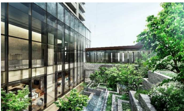
プライベートガーデン(完成予想図)