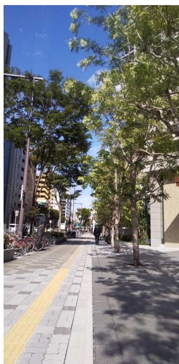
西側歩道状公開空地