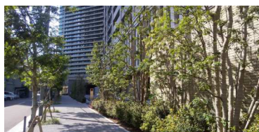
南側歩道状公開空地